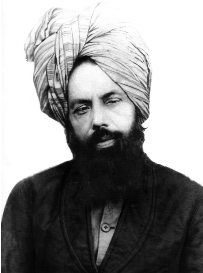
Der Verheißene Messias und Mahdi des Islam, Hadhrat Mirza Ghulam Ahmad von Qadian as (1835-1908)