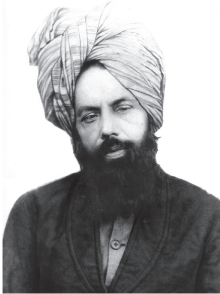
Der Verheißene Messias und Mahdi des Islam, Hadhrat Mirza Ghulam Ahmad aus Qadian AS (1835-1908)