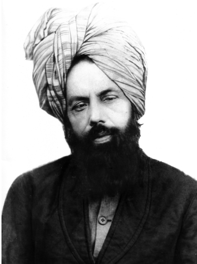
Der Verheißene Messias as und Mahdi des Islam, Hadhrat Mirza Ghulam Ahmad von Qadian (1835-1908)