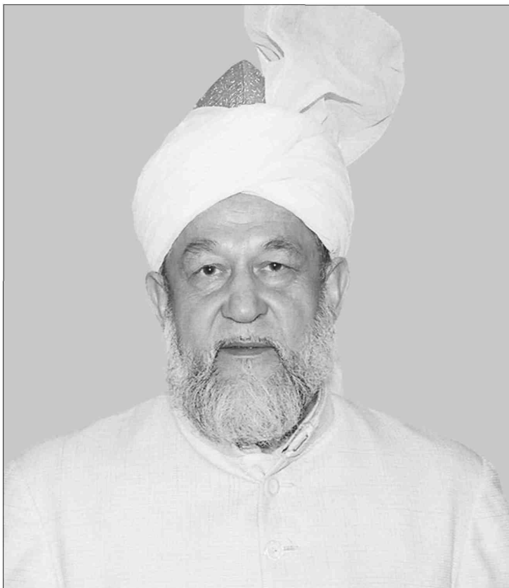
Hadhrat Mirza Tahir Ahmad RH (1928-2003) Vierter Kalif des Verheißenen Messias AS des Islam Viertes Oberhaupt der Ahmadiyya Muslim Jamaat